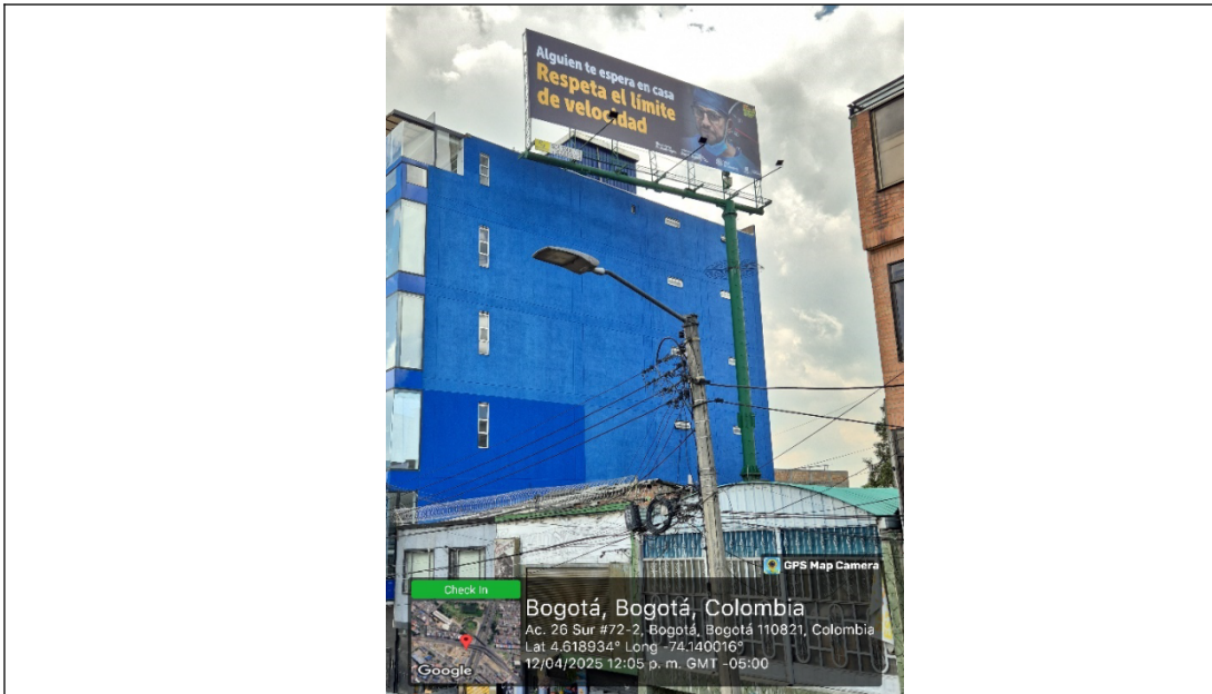
Foto No. 2 – Vista del panel orientación Este - Oeste y de la estructura de la valla, en buenas condiciones y estable.