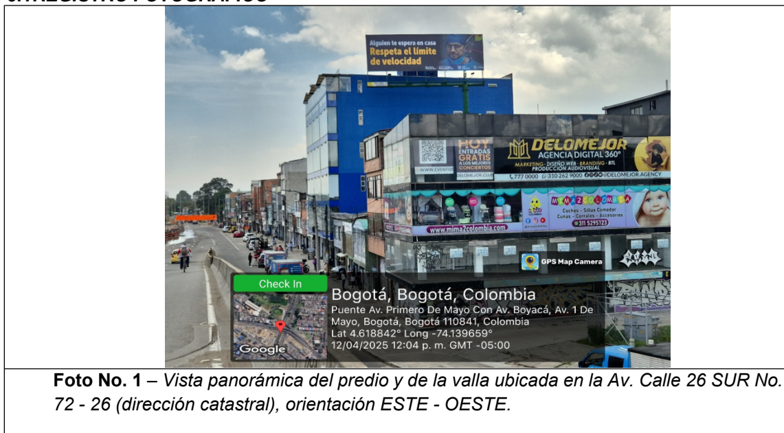
Foto No. 1 – Vista panorámica del predio y de la valla ubicada en la Av. Calle 26 SUR No. 72 - 26 (dirección catastral) , orientación ESTE - OESTE .